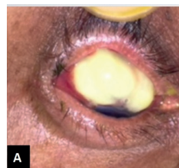
Figura 1: A) Bolha opaca e purulenta 14º dia pós-operatório. / B) Esclera desnuda cercada por estruturas friáveis. / C) Autotransplante conjuntival após três meses com a esclera nua.