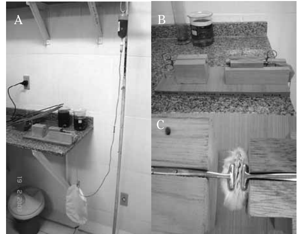
Figura 2 - Aparelhagem de aferição da força de ruptura. Vista panorâmica (A); vista lateral (B); e vista superior (C) da aparelhagem.

enchida por água acaba por provocar o afastamento das extremidades do fragmento gerando tensão e conseqüente ruptura da incisão cirúrgica cicatrizada. A partir daí, o volume do líquido que provocou a ruptura é mensurado em gramas, obtendo assim, o peso correspondente à força de adesão.